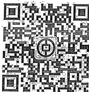
关注中行山西分行